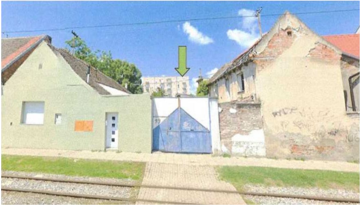
Fotografija iz okruženja-iza ulične čestice na adresi Divaltova 72