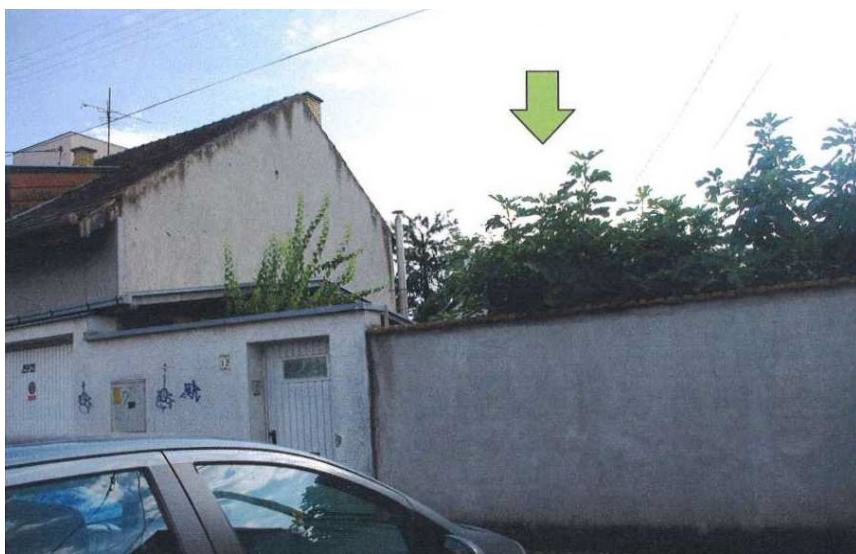
Fotografija iz okruženja-iza ulične čestice na adresi kralja Petra Svačića iza kućnog broja 15