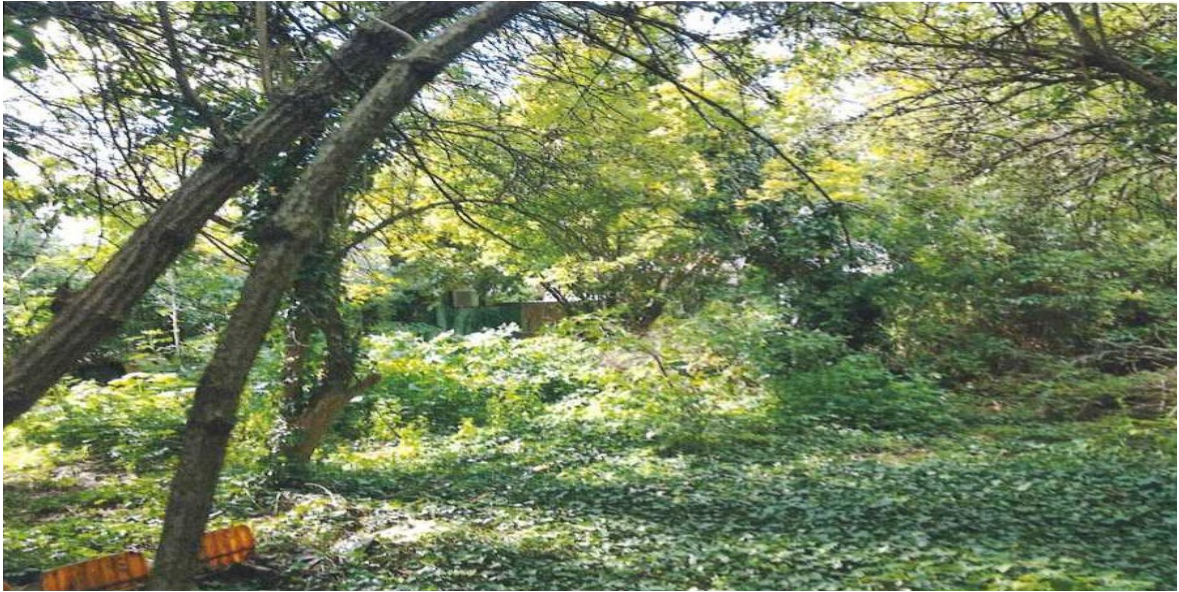
Fotografija iz okruženja-iza ulične čestice na adresi Frankopanska 92